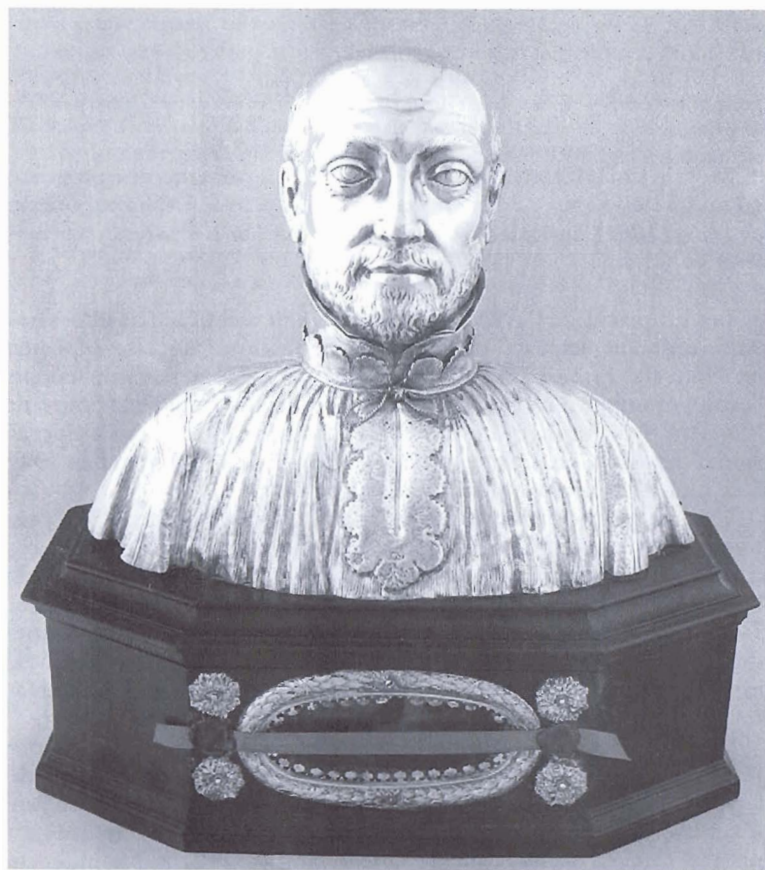
FIG. 1. — QUÉBEC, MONASTÈRE DES AUGUSTINES DE L'HÔTEL-DIEU, BUSTE-RELIQUAIRE DE SAINT JEAN DE BRÉBEUF, PAR CHARLES DE POILLY, PARIS, 1664 (Cliché R. Derome).

lement date des dernières manipulations des reliques, dans les années 1920 4 . Le buste est monté par assemblage et soudure d'épaisses feuilles de métal repoussé et ciselé; l'intérieur est vide et fixé au socle de bois au moyen de deux gros pitons métalliques. Le jésuite porte un haut col dur fait de deux lames d'argent appliquées l'une contre l'autre, dans lequel s'encastre la tête; il est revêtu d'un rochet, habit