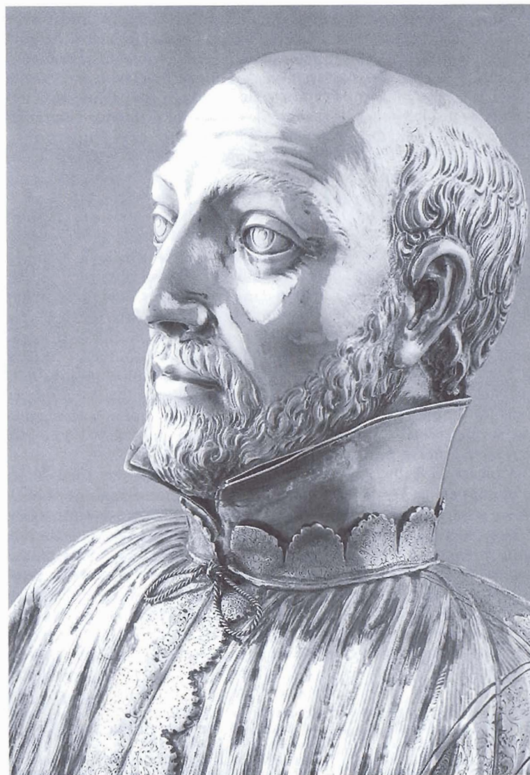
FIG. 2. — BUSTE-RELIQUAIRE DE SAINT JEAN DE BRÉBEUF : DÉTAIL DU VISAGE (Cliché R. Derome).